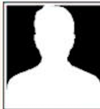
Maxamed Ismaaciil Cumar